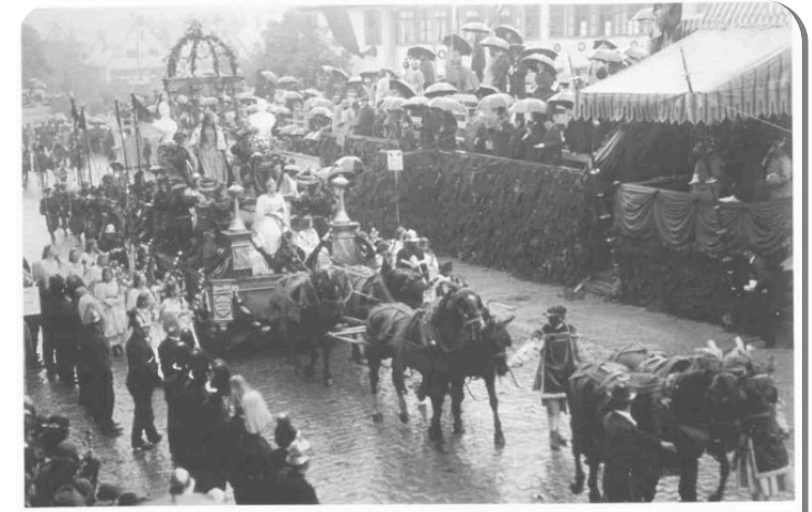
Abb. 2: Wagen der »Freudenstadtia« im Festzug 1899.

Eine ausführliche Beschreibung und Bewertung dieser Feier vermittelt Gerhard Faix (4) , der nicht nur auf die Darstellung der grundlegenden geschichtlichen Ereignisse aufmerksam macht, sondern in der Gestaltung auch die Treue zum Königshaus und den Bürgerfleiß als wichtigste Tugenden der Stadtbürger