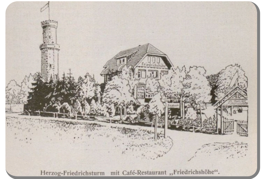
Herzog-Friedrichsturm mit Café-Restaurant „Friedrichshöhe“.

Mittwoch, 27.09. , 10 h: Frühkonzert auf dem Marktplatz. 12 h: Läuten aller Glocken. 14 h: Kinderfest auf dem Turnhalleplatz mit Festzug vom Marktplatz durch die Stadt. 20 h: Festball in der Turnhalle.